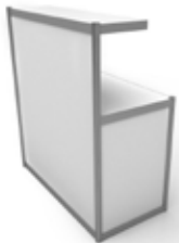
Ref. MD110 Mostrador Counter 110x100x50