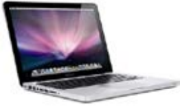
Ref. CA001 Ordenador Ordi