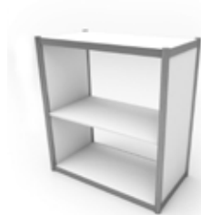
Ref. M85SP Mostrador Counter 85x80x43