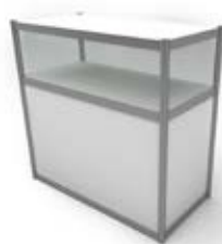
Ref. MV961 Mostrador vitrina Counter Low counter 96x100x50