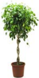
Ref. CF001 Árbol formado Arbre format