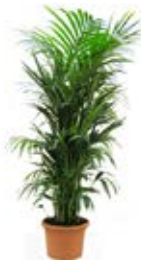
Ref. CF002 Kentia Kentia