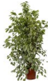
Ref. CF003 Phicus Phicus