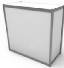
Ref. M9610 Mostrador Counter 96x100x50