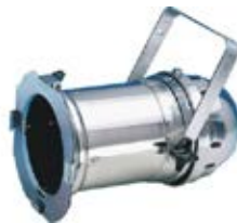
Ref. CI003 Cañón 500-100W Cannon 500-100W