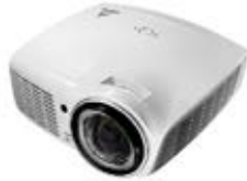
Ref. CA002 Proyector Projector