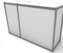
Ref. M9615 Mostrador Counter 96x150x50