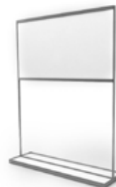
Ref. PM193 Panel Panel 250x193x25