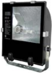
Ref. CI001 HQI 400W HQI 400W