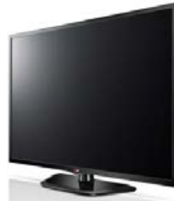
Ref. CA004 Ref. CA005 Pantalla plasma Plasma display