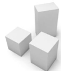
Ref. POD50 50x50x50 Ref. POD70 50x50x70 Ref. POD10 40x60x100 Podium Podium