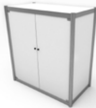
Ref. M85CP Mostrador Counter 85x80x43