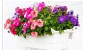
Ref. C005 Jardinera Jardinera