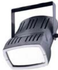
Ref. CI002 HQI 150W HQI 150W