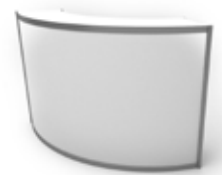
Ref. MC110 Mostrador Counter 110x215x35